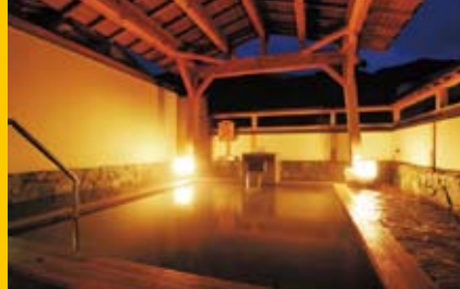
弥彦温泉源泉掛け流し露天風呂